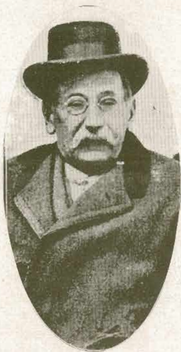
EL ÚLTIMO RETRATO DE PÉREZ GALDÓS

En uno de los telegramas de Stockolmo anunciando la atribución del Premio Nobel a Peter Rosegger, hay,