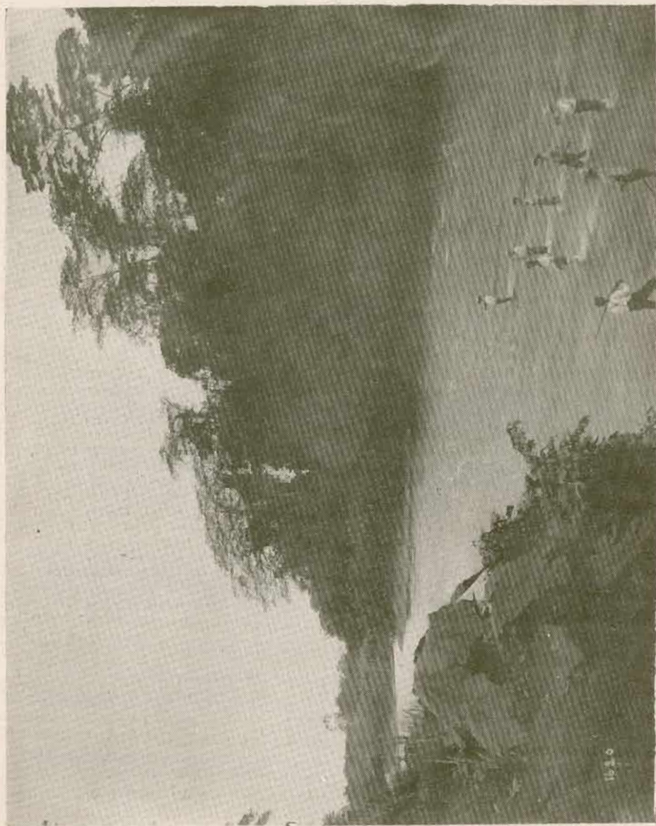
GUARDAS DE HACIENDA CRUZANDO EL RIO TORO AMARILLO.—Provincia de Limón