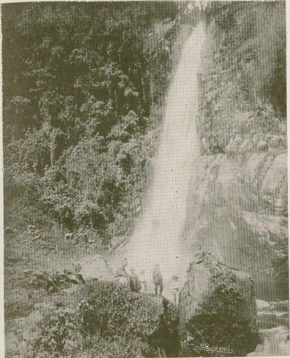
CATARATA DE OROSI —Provincia de Cartago