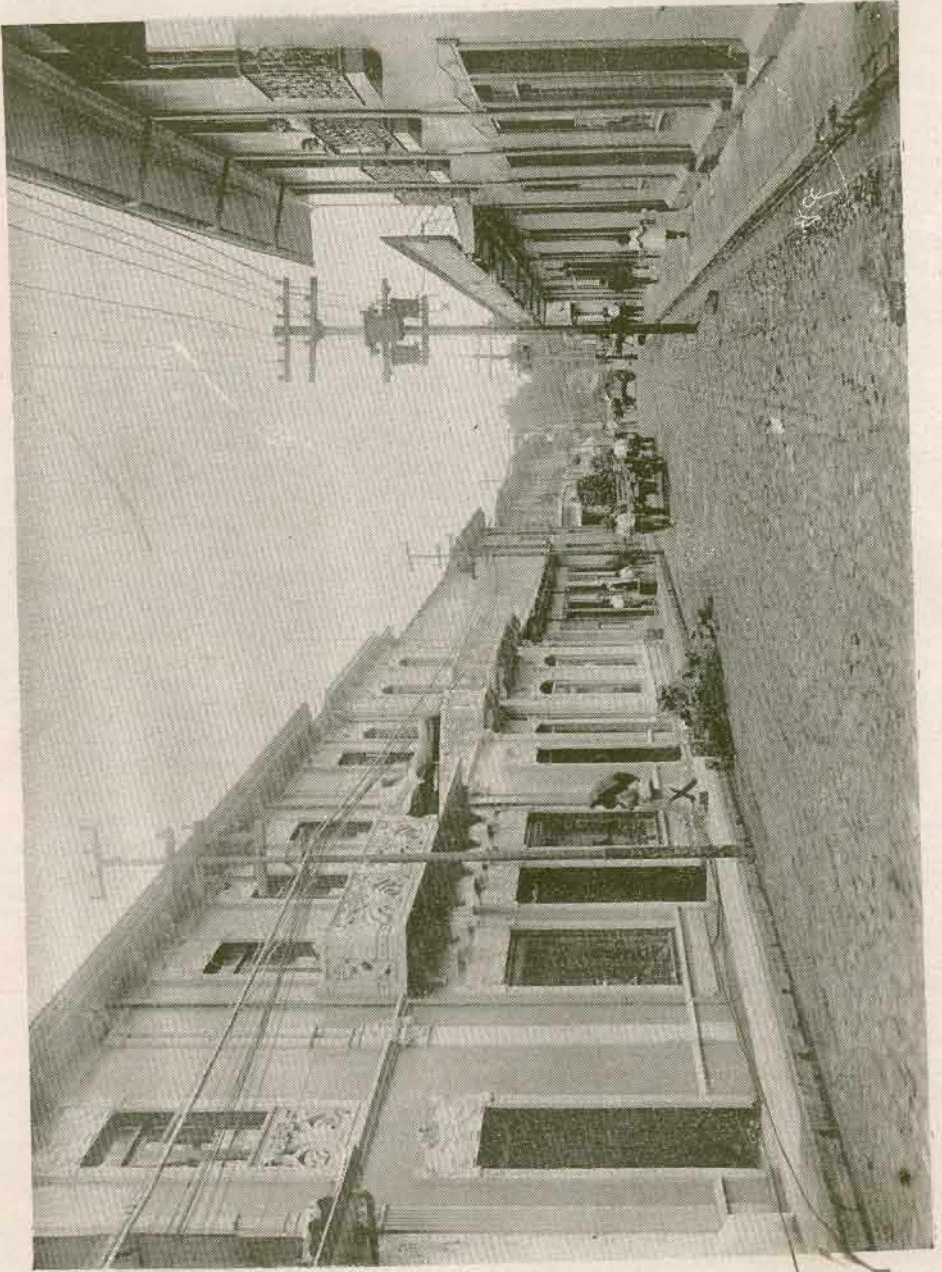
AVENIDA DE LAS DAMAS.—San José, Costa Rica

JOSE - ESTANISLAO MARIA - CONCEL JOSE - ESTANISLAO